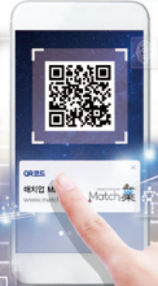
QR코드를 인식하면 매치업 홈페이지로 연결됩니다

기업 · 산업체와 교육기관이 함께 만드는 온라인 중심의 산업맞춤 단기교육과정 입니다