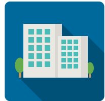
기업 · 산업체

향후, 학점은행제 학점인정, 취업 연계 등으로 다양하게 활용할 수 있습니다.